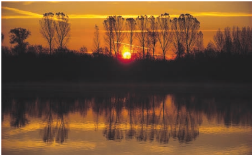
Woda jest żywiołem.