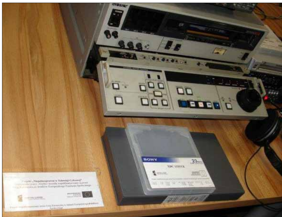
Przegrywanie czas zacząć...