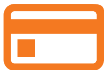
lub przelew na konto

UWAGA! Możesz odliczyć tylko darowiznę przekazaną na konto bankowe organizacji.