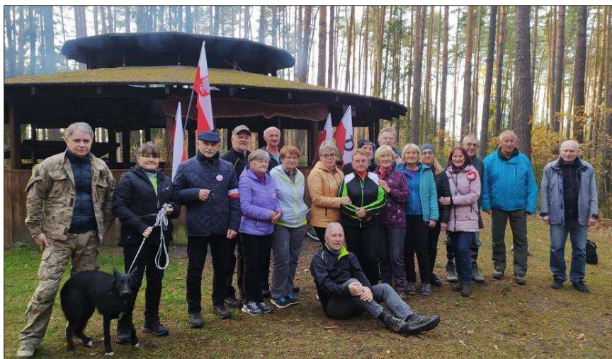
Powyżej – XII Marsz Niepodległości TTH – 11 listopada 2023. Uczestnicy spotkania przy ognisku na leśnej polanie obok Jeżowego Stawu.