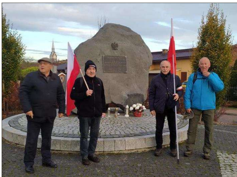
Powyżej – XII Marsz Niepodległości TTH – 11 listopada 2023. Pomnik 100-lecia Odzyskania Niepodległości w Niemodlinie.

Przypatrz się polska potomności, jak wielki pożytek przyniosła ci cześć Bogarodzicy, którą razem z rzymskokatolicką wiarą twój Apostoł św. Wojciech, Arcybiskup Gnieźnieński i Męczennik, tak troskliwie rozszerzał! Idź więc za świętymi przykłady twoich przodków: bo jeżeli cześć Maryi zachowywać, z gorliwością ją rozszerzać i wspaniałomyślnie jej bronić będziesz, najwięcej wtedy pożytku sobie przyniesiesz i dla samych zwolenników piekła straszną się staniesz.