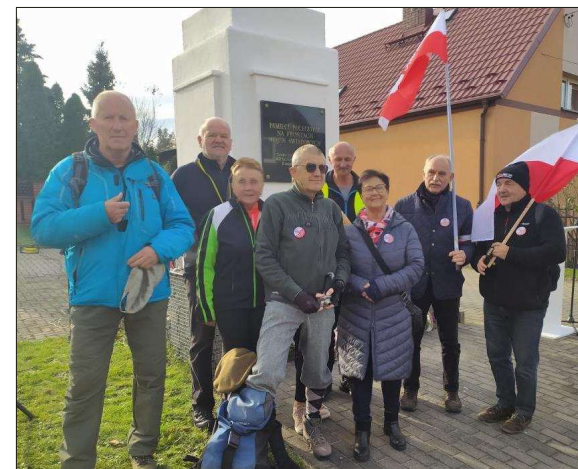
Powyżej – XII Marsz Niepodległości TTH – 11 listopada 2023. Pomnik pamięci Poległych na Frontach Wojen Światowych w Tułowicach.

Oby Anioł wojsk Pańskich, Stróż Polski, mógł pobudzić zastępy niebieskie do składania wspólnie z nami dzięków Najwyższemu Majestatowi Boga za tak wielkie dobrodziejstwo – i niech wszystkich nieprzyjaciół, którzy się sprzyjęli na wykorzenienie w Polsce czi Królowej Aniołów, potężną swą ręką rozprószy. 7