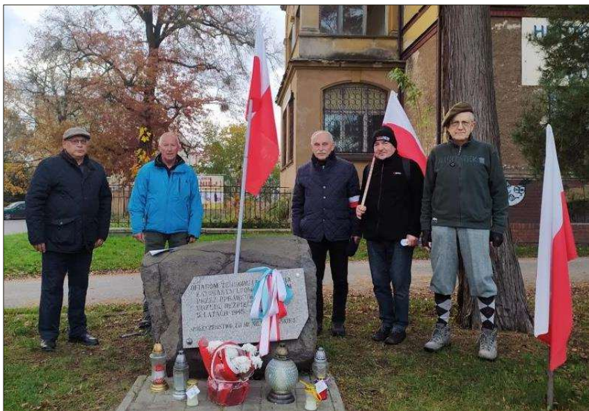
Powyżej – XII Marsz Niepodległości TTH – 11 listopada 2023. Tablica pamiątkową, poświęconą ofiarom Powiatowego Urzędu Bezpieczeństwa w Niemodlinie.