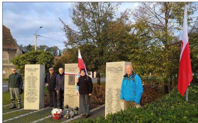
Powyżej – XII Marsz Niepodległości TTH – 11 listopada 2023. Pomnik Obrońców Przebraża w Niemodlinie.

Nie będzie Niemiec pluć nam w twarz, Ni dzieci nam germanił. Wstanie potężny hufiec nasz, Duch będzie nam hetmanił W ten dzień, gdy zagrzmi złoty róg! Tak nam dopomóż Bóg!/bis