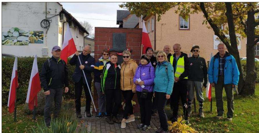
Powyżej – XII Marsz Niepodległości TTH – 11 listopada 2023. Tablica upamiętniająca 200-tną rocznicę uchwalenia Konstytucji 3 Maja w Tułowicach.