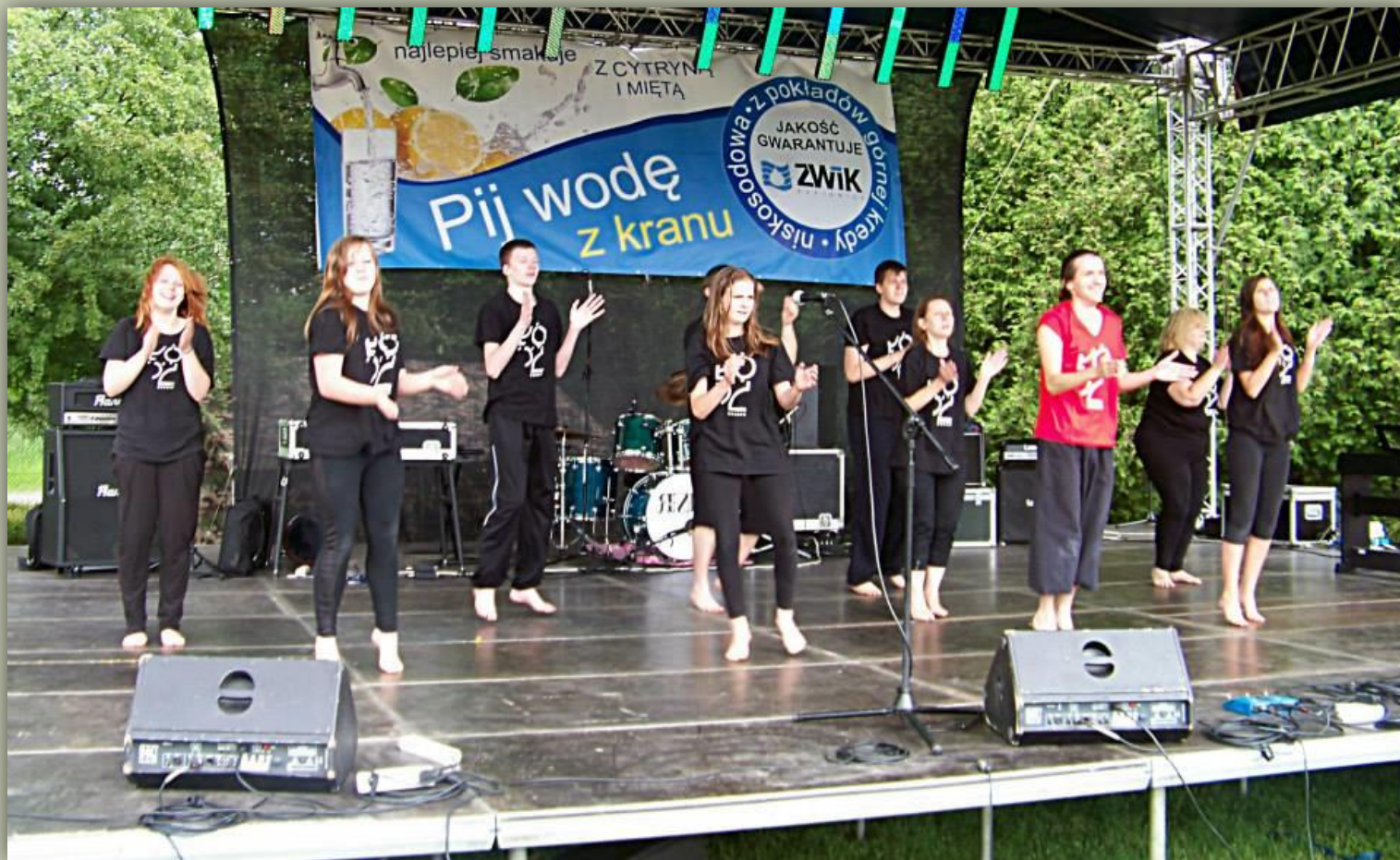
Go Pomost! Voluntary Dance Art Group