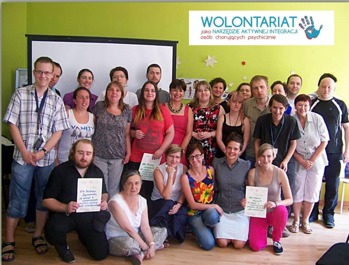
„Wolontariat jako narzędzie aktywnej integracji osób chorujących psychicznie” (01.03.2012-31.10.2014)