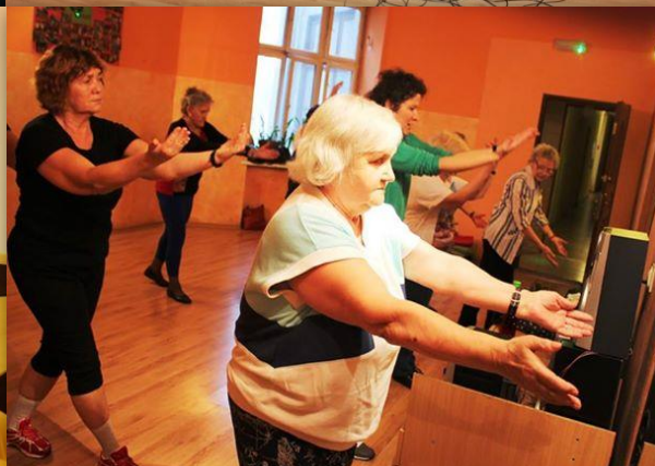
Akademia Wolontariatu Seniora (01.05.2014-31.12.2014)