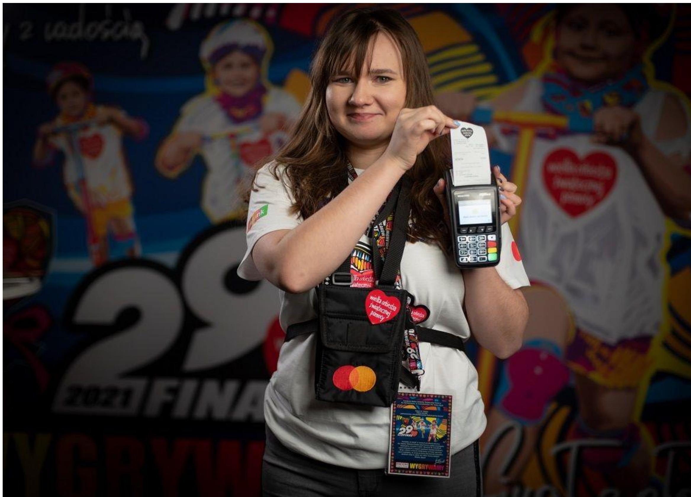
Terminal płatniczy WOŚP towarzyszy tradycyjnej kweście