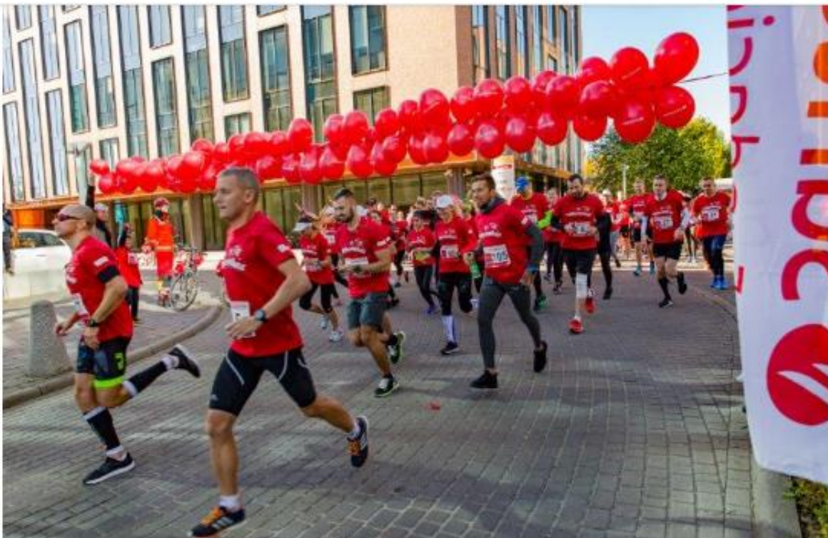
Północny Pomaga 2019

Cel: zbiórka pieniędzy dla Hospicjum Domowego im. ks. E. Dutkiewicza SAC w Gdańsku