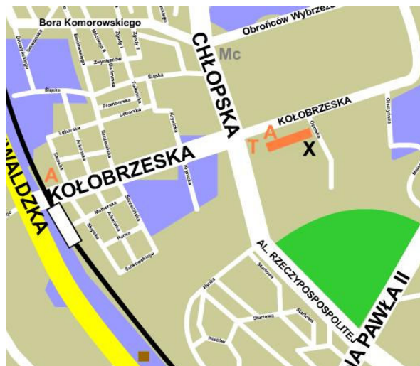
mapa z portalu www.trojmiasto.pl

Spotkania klubowe odbywają się w środy (17 – 19) i soboty (13 – 18).